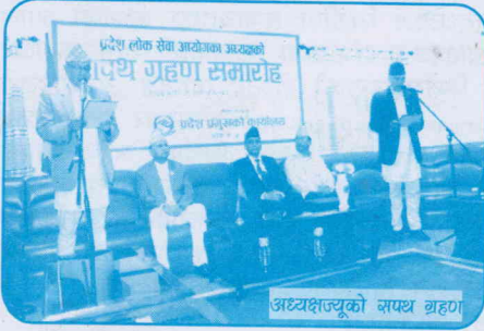
अध्यक्षज्यूको सपथ ग्रहण