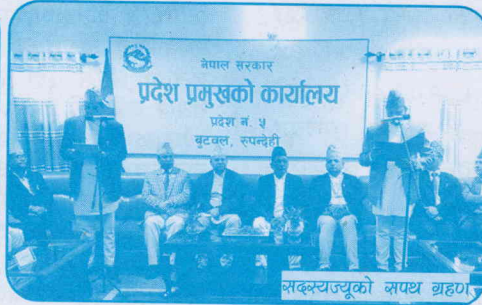
सदस्यज्यूको सपथ ग्रहण