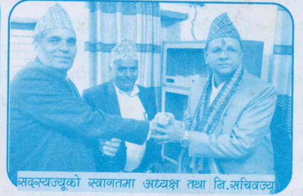
सदस्यज्यूको स्वागतमा अध्यक्ष तथा नि.सचिवज्यू