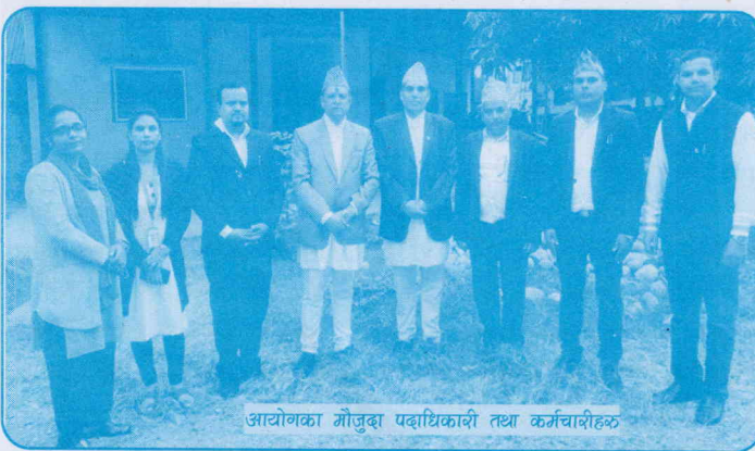
आयोगका गौजुका पदाधिकारी तथा कर्मचारीहरू